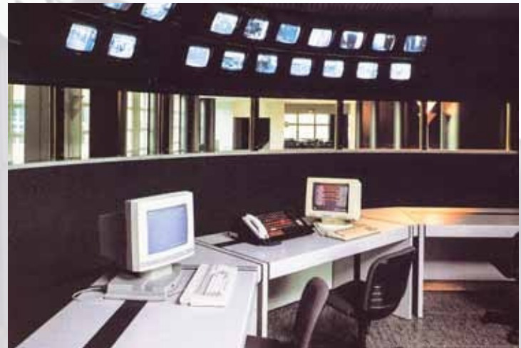
Control Room del Tecnocentro, 1987