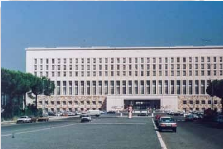
Ministero degli Affari Esteri, anni Ottanta, Roma

L'azienda è tra le prime realtà in Italia ad introdurre il sistema di controllo accessi: l'uso del badge, che permette di riconoscere ed autorizzare in modo automatico l'accesso ad aree riservate, era fino ad allora del tutto sconosciuto.