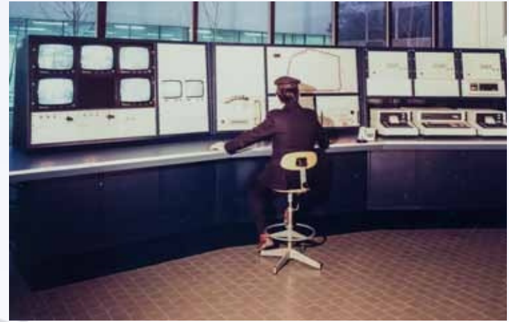
Control Room della Direzione Centrale dei Servizi di Sicurezza Militare, Roma 1982