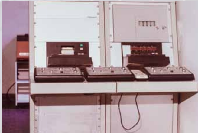
Control Room della Farnesina, Ministero degli Affari Esteri, Roma, 1983

Per questi progetti, Teleimpianti stipula un accordo di partnership con un produttore americano, accordo che è operativo da oltre 30 anni.