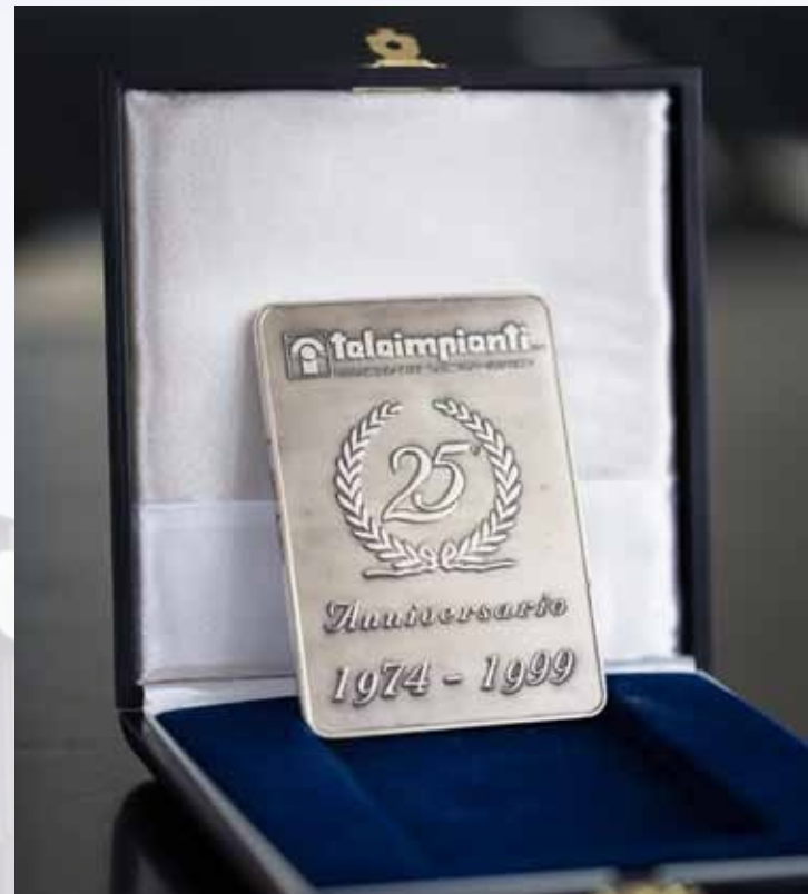
Lingotto realizzato nel 1999, per i 25 anni di Teleimpianti, in un numero limitato di copie

Con queste parole, il presidente di Teleimpianti festeggia i 25 anni dell'azienda.