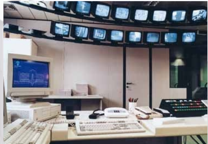
Control Room del Centro Servizi FriulAdria, 1991

L'Europa si dà un ordinamento comune e fissa una moneta unica. Le comunicazioni vivono un momento senza precedenti, pari solo alla scoperta e commercializzazione del telegrafo senza fili e delle radiocomunicazioni da parte di Guglielmo Marconi nel 1895.