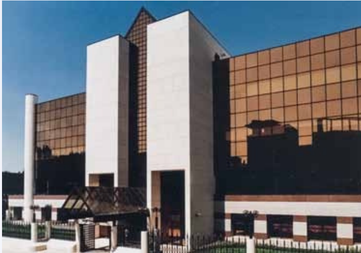
Palazzo del Centro Servizi FriulAdria a Pordenone, 1991