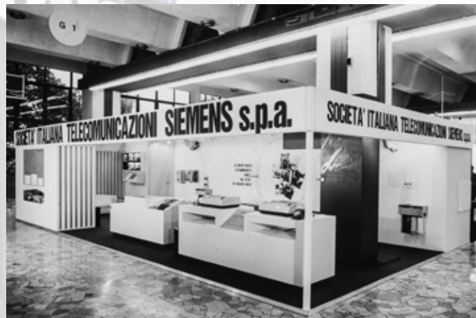
Lo stand di Siemens alla Fiera di Milano nel 1978