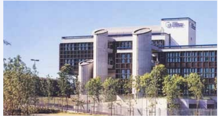
Palazzo del Centro Servizi della Cassa di Risparmio in Bologna, presso il Tecnocentro a Casalecchio di Reno (Bo), 1987