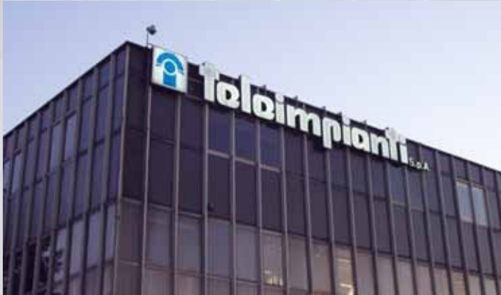
La filiale di Teleimpianti a Modena

Il 1991 segna un altro traguardo importante: inizia il rapporto con IBM, che porta alla realizzazione dell'intero