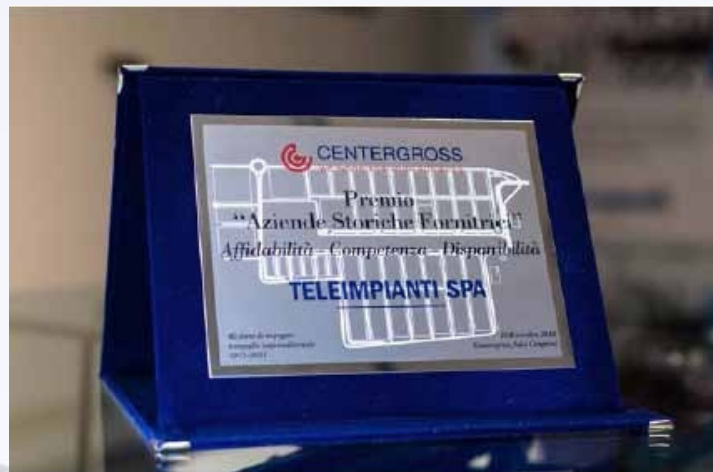
Premio "Aziende Storiche Fornitrici" dato da Centergross a Teleimpianti nel 2012.

Intanto si consolidano i rapporti con i clienti storici e nel 2004, su progetto della Fiat Engineering e con l'apporto architettonico del prestigioso studio Isola di Milano, viene realizzato il più grande sistema di sicurezza messo a punto dall'azienda bolognese presso la nuova sede di IBM Italia a Segrate, conosciuta in Italia e all'estero come una delle più importanti realtà IBM del mondo.